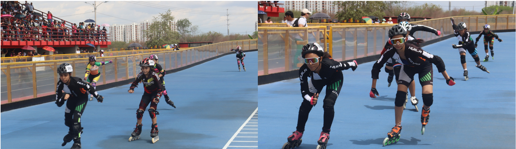
Patinadores de diferentes municipios del Huila se dieron cita en Neiva.

Más de trescientos deportistas se dieron cita para la realización del Festival Departamental de Escuelas, Novatos y Federados de Patinajes de Carreras organizado por UTRAHUILCA. El encuentro deportivo permitió además evaluar los procesos formativos de los clubes adscritos a la entidad naranja, blanco y verde.