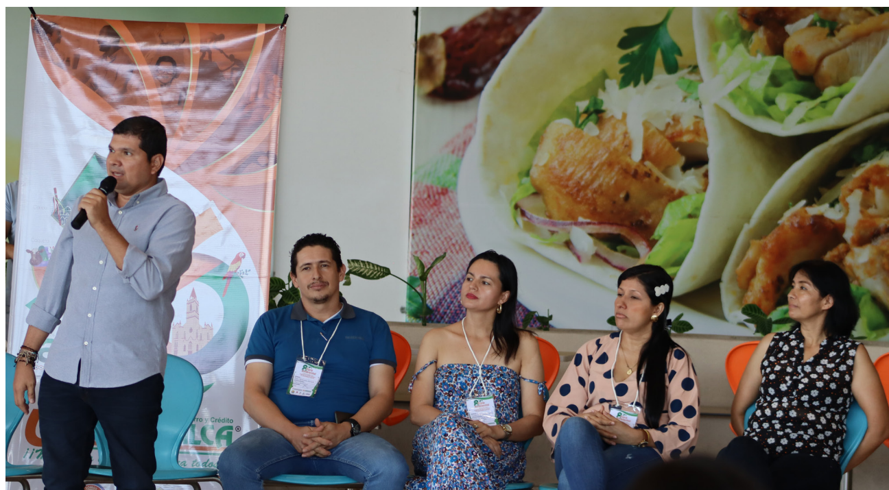
Al finalizar las ponencias, los docentes participaron en un panel en el que expresaron sus apreciaciones del Foro.

La octava versión del Foro Ambiental de la Fundación Social UTRAHUILCA fue inédita por la participación de instituciones educativas de diferentes zonas del país. Esta vez no solo participaron colegios del sur de Colombia, en esta ocasión la geografía del encuentro se expandió a territorio cordobés y cundinamarqués. De esta manera, el Foro tuvo un enriquecimiento académico y cultural,