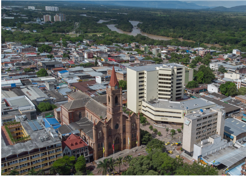
La proyección de Neiva para los próximos cuatro años será clave en los avances del turismo en la ciudad.

Con la llegada de la época de final de año diferentes atractivos acaparan la atención para disfrutar de la temporada de vacaciones, desde turismo cultural hasta de aventura y de descanso son los preferidos por los colombianos. ¿Neiva, la 'capital del río Magdalena' hace parte de los destinos elegidos por nacionales y extranjeros?