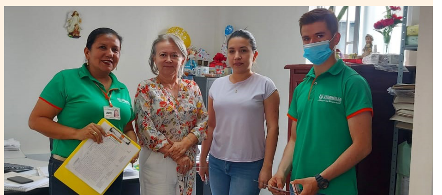
UTRAHUILCA La Plata muestra la presencia e importancia de sus servicios para la comunidad con estas actividades, comprometida con el bienestar de sus asociados.