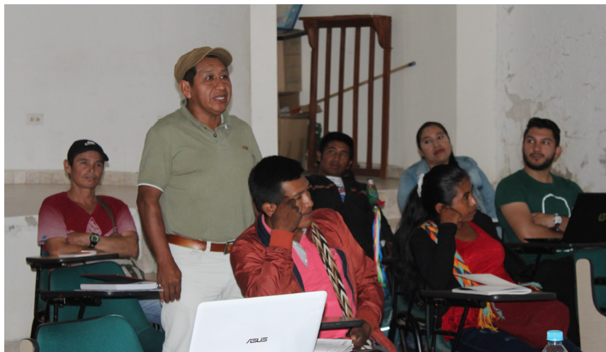
En el mes de diciembre se espera hacer la entrega de los certificados de capacitación y conformación de la organización.

El taller se ofreció a diferentes líderes de las organizaciones regionales como: Togoima, Ricaurte, Pickwe tha fxiw, Avirama, La Palma, Cohetando, Nega cxhab, Belalcázar, y Corporación Nasa Cxhab; en donde en conjunto se logró el objetivo del curso; con grandes enseñanzas, reflexiones y actitud positiva con el fin de avanzar en el proceso de constitución de Cooperativa Multiactiva Nasa del oriente caucano “CoopNasa”.