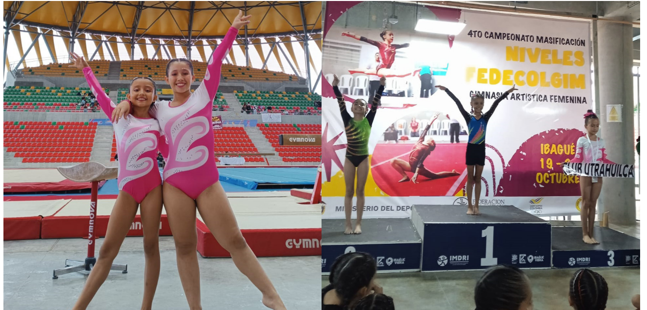
Excelente participación de gimnasia de UTRAHUILCA en Ibagué.