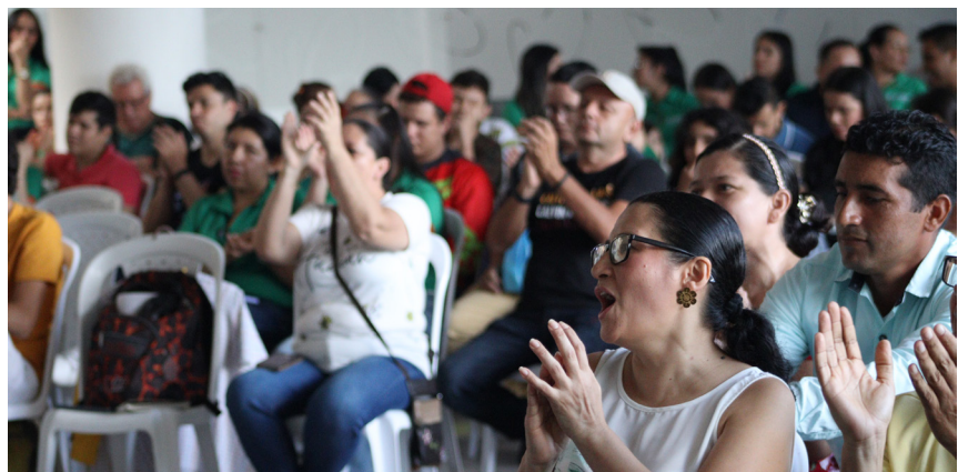
El público reconoció el talento de niños y niñas en tarima.