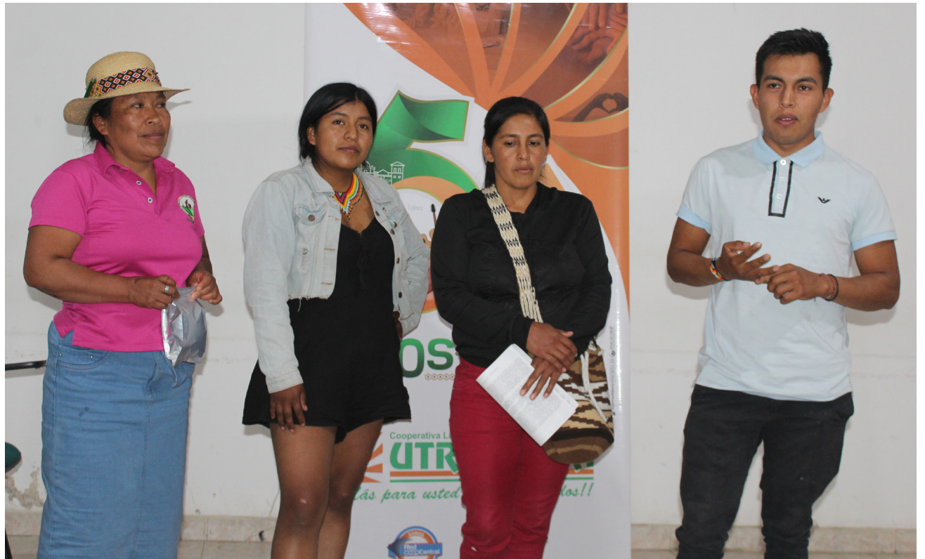
En el Cauca la Cooperativa UTRAHUILCA y FUNDAUTRAHUILCA siguen construyendo un mejor territorio con las comunidades indígenas.