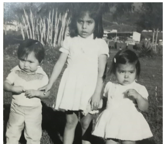
Junto a sus hermanos cuando eran niños.