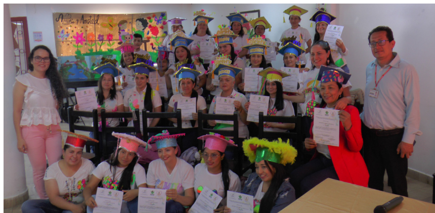
La cooperativa UTRAHUILCA agencia Isnos sigue siendo de trabajo comunitario en la región sur del Huila.