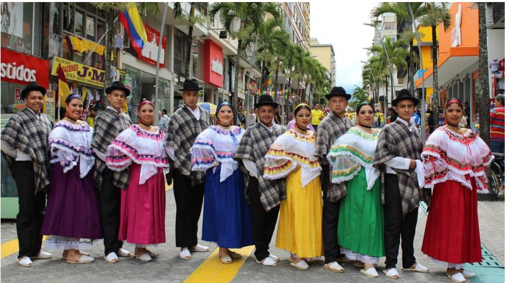
A nivel nacional han logrado un importante reconocimiento.