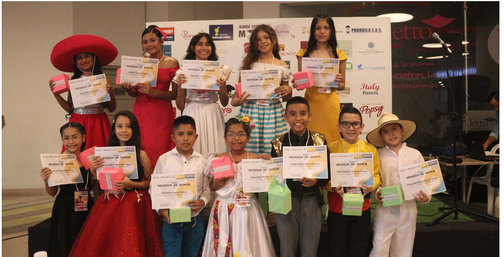
Cada concursante recibió un certificado y un detalle.

Niños y niñas cautivaron a los asistentes con su aptitud en tarima. Temas musicales de compositores nacionales amenizaron la jornada.