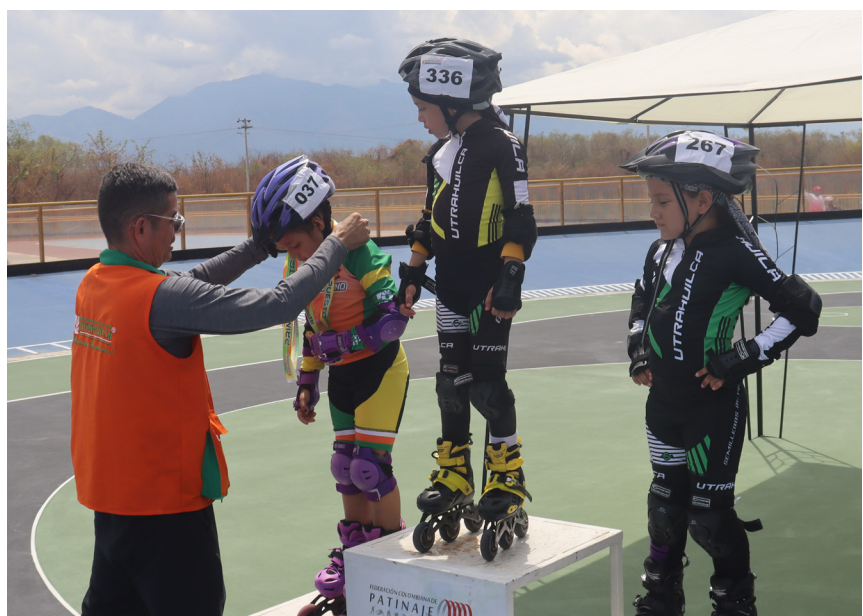
Deportistas de cada categoría con los mejores resultados lograron estar en el pódium.