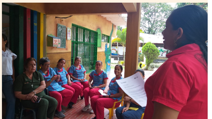
En el hogar, se contó con la participación de 13 personas interesadas en la labor que desempeña UTRAHUILCA y FUNDAUTRAHUILCA.