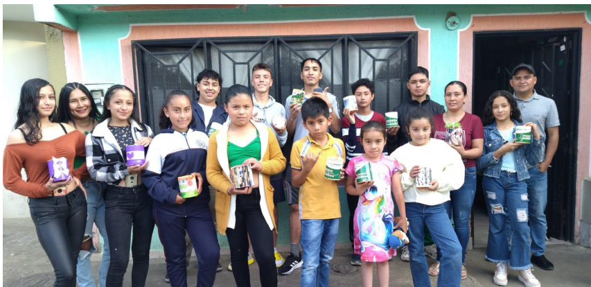
La Escuela de Música AYMARU MASI de FUNDAUTRAHUILCA Isnos participó de la jornada formativa con gran alegría.

Estas acciones reflejan el compromiso continuo de la Cooperativa con el bienestar y desarrollo de la comunidad, utilizando la educación y actividades sociales como herramientas clave para alcanzar un impacto positivo y duradero en la vida de los habitantes de Isnos.