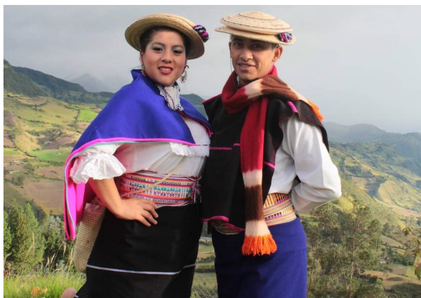
El proyecto busca preservar las tradiciones culturales de los pueblos indígenas del Cauca

El optimismo de cara al futuro es el mejor. La Agrupación