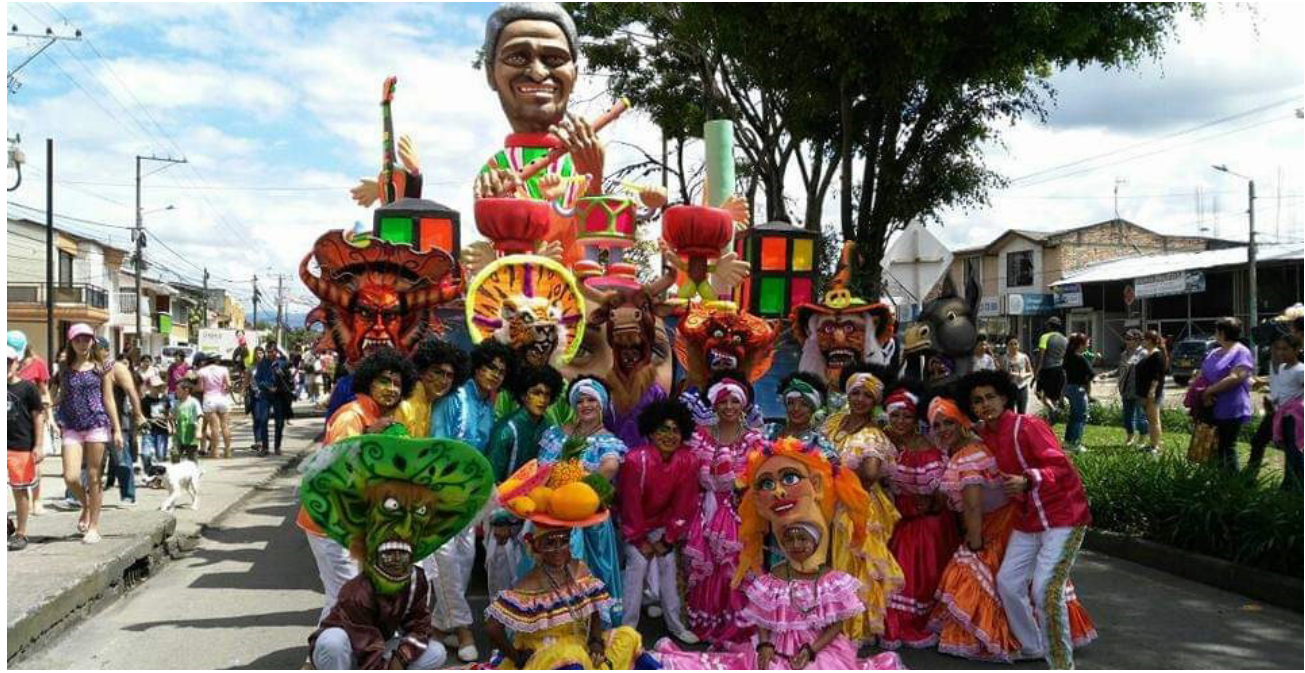
Kasrak siempre hace presencia en las festividades autóctonas del municipio.