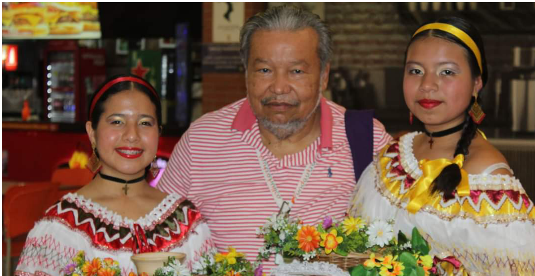
Desde la casa tricolor se han impulsado este proceso formativo.

Los reconocimientos logrados a nivel municipal, departamental y nacional son la carta de presentación de este proyecto naranja, blanco y verde.