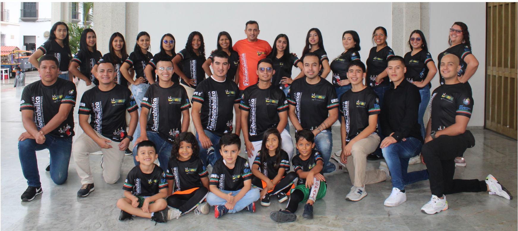
Agrupación Folclórica Caucana Kasrak, de FUNDAUTRAHUILCA.