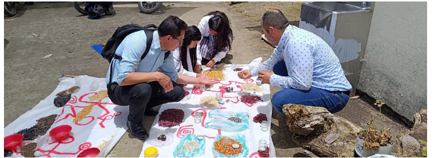
Durante la jornada, se realizaron diversos juegos de conocimiento y recreativos.