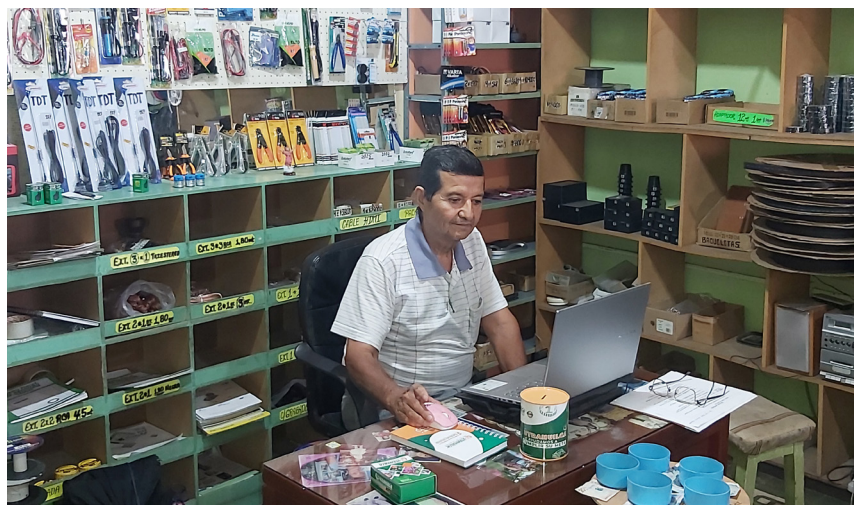
Su puesto de trabajo cuenta con los implementos necesarios para sus labores diarias.