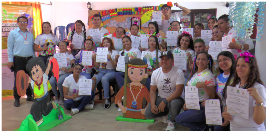
Fueron más de 40 mujeres las que recibieron el certificado de capacitación por parte de ITELSO.

El diplomado tuvo una intensidad de 60 horas, dictadas en diferentes jornadas durante la semana, y se desarrolló en cuatro ejes que