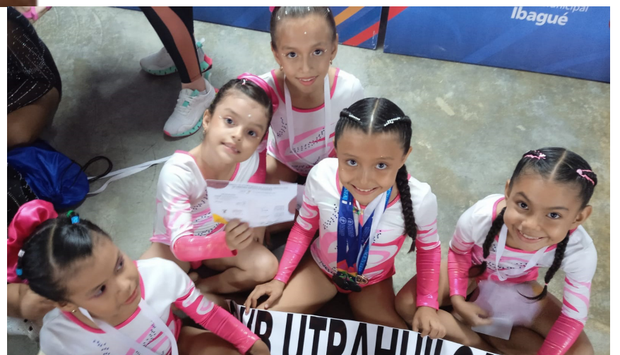
Deportistas del club UTRAHUILCA en participación nacional.