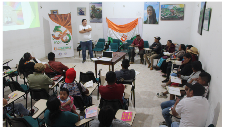
La casa solidaria sigue fortaleciendo a las comunidades de base que son las que generan la economía alterna del país.