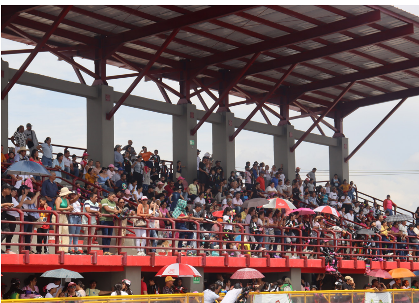
Padres de familia agradecieron a FUNDAUTRAHUILCA el apoyo permanente y decidido con el deporte de la región.

De esta manera la disciplina de Patinaje de la cooperativa UTRAHUILCA finalizó su agenda de eventos oficiales apoyados por la Liga de Patinaje del Huila planificando lo que será su participación en el calendario deportivo para el 2024.