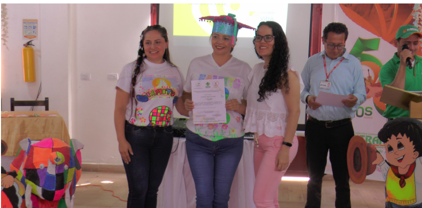
La educación es la base de la casa utrahuilqueña para lograr el cambio social.

Como compromiso final la familia utrahuilqueña acordó seguir con estos procesos de capacitación teniendo en cuenta las necesidades de la población en la región surcolombiana, pero además agradeció la confianza depositada en el trabajo cooperativo y solidario para el desarrollo local.